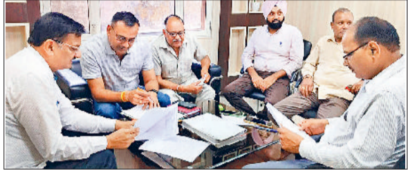
यमुनानगर के कृषि विभाग के उपनिदेशक कार्यालय में जांच करती मुख्यमंत्री उड़नदस्ते की टीम।

विभाग के अधिकारियों ने यूरिया तस्करी करने वालों को फायदा पहुंचाने के लिए सैपल जांच