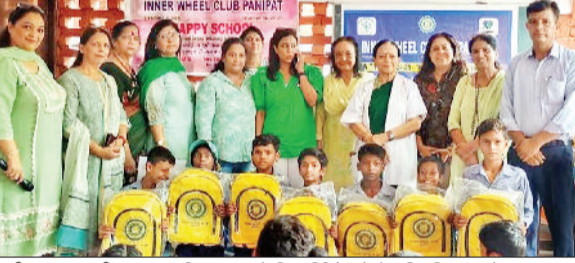
पानीपत। राजकीय स्कूल, निजामपुर में विद्यार्थियों को बैग वितरित करते हुए इनर व्हील क्लब की सदस्य।