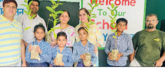
पानीपत। आसरा फाउंडेशन के स्वयंसेवी, जरूरतमंदों को राशन बांटते हुए।

राशन में आसरा फाउंडेशन ने रोजभरा में इस्तेमाल होने वाले रसोई का सामान जैसे 10 किलो आटा, चीनी, दालें, तेल, चावल, नमक इत्यादी वितरित किया।