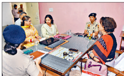
की व इन मामलों को जल्द निपटाने के निर्देश दिए।