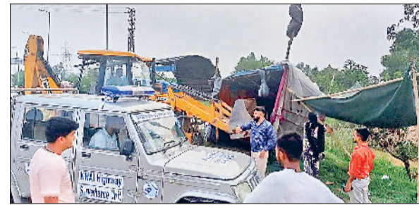
अंबाला। हाइवे से अतिक्रमण हटाते कर्मचारी।

नारायणागढ़। प्रदेश सरकार की ओर से आमजन मानस की समस्याओं को दूर करने के उद्देश्य से प्रत्येक कार्य दिवस में लगाए जा रहे समाधान शिविर लोगों के लिए कल्याणकारी सिद्ध हो रहा है और वे इस अनूठी पहल की सराहना कर रहे हैं। समाधान शिविर में अपनी समस्या लेकर आने वाले लोगों की परेशानियों को एसीडीएम यश जालुका द्वारा एक-एक समस्या को ध्यान पूर्वक सुन कर संबंधित विभाग के अधिकारियों के माध्यम से दूर करवाया जाता है। शिविर में 16 लोगों ने समस्या रखी। मौके पर ही सभी का समाधान हो गया।