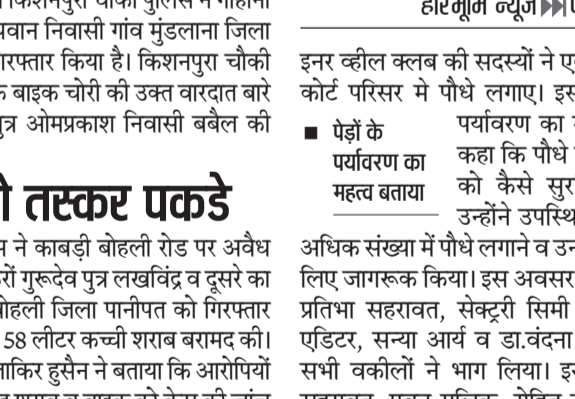
पानीपत। इनर व्हील क्लब की सदस्यगण, कचहरी परिसर में पौधे रोपते हुए।

इनर व्हील क्लब की सदस्यों ने एको पानीपत डिस्ट्रिक्ट कोर्ट परिसर में पौधे लगाए। इसके साथ ही पेड़ों के