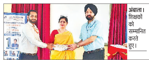
अंबाला। शिक्षकों को सम्मानित करते हुए।

श्रीमफॉर्ड स्कूल के प्रांगण में नारायणा टीम की ओर से मेधावी विद्यार्थियों के लिए कार्यशाला का आयोजन किया गया। इसमें वर्ष 2023-2024 में कक्षा 10वीं व 12वीं के मेधावी विद्यार्थियों को पुरस्कृत किया गया। उन्हें अपने भविष्य में विषयों का चयन सोच समझ कर करने के लिए प्रेरित किया गया। टीम का मूल उद्देश्य बच्चों को प्रेरित करना है कि वे किसी दबाव में आकर अपनी यादशत दिखाने के लिए विषयों का चयन न करें बल्कि अपनी रुचि व क्षमता के अनुसार